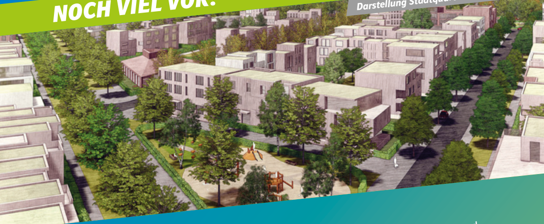
Darstellung Stadtquartier Lichtenreuth