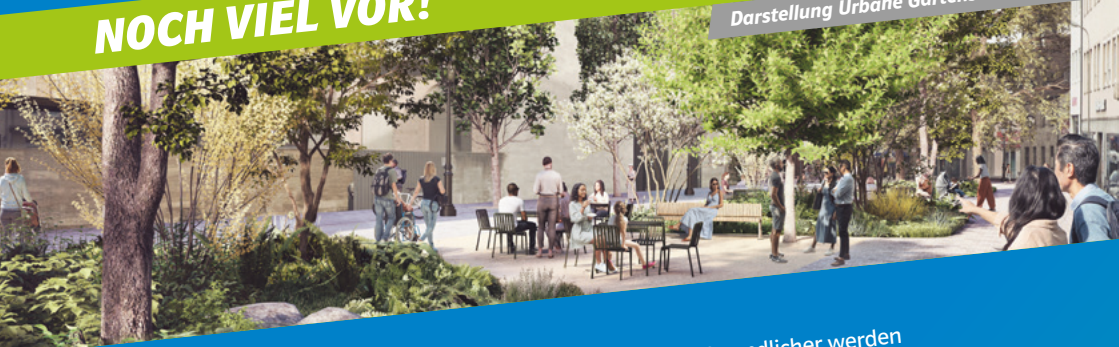
Darstellung Urbane Gartenschau 2030