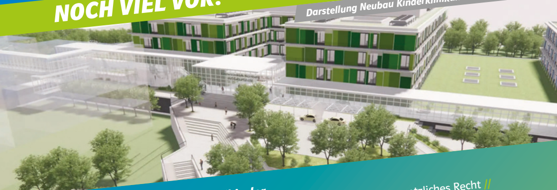
Darstellung Neubau Kinderklinikum am Campus Süd